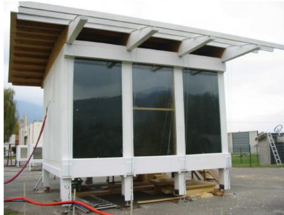
Figure 9 : Maquette expérimentale – vue extérieure