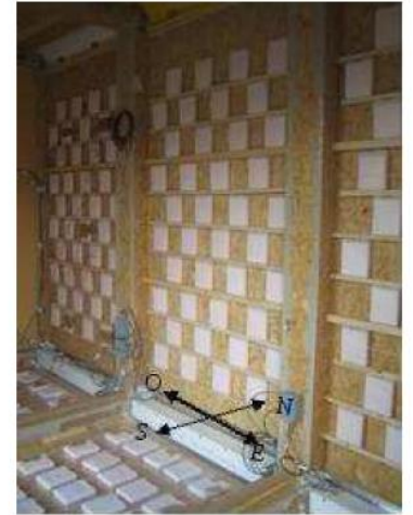
Figure 10 : Intérieur de la maquette contenant les MCP

Objectifs : Enveloppe Hybride à Haute Performance Energétique pour maisons à ossature bois, Couplages Actifs Isolation-Inertie-Apports Solaires et Sol-Air