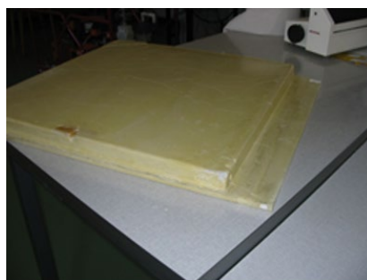
Prototype en PIV, en cours de montage

06 07 46 78 27 bruno.georges@oteis.fr www.oteis.fr